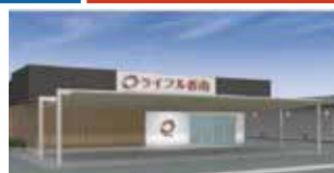
家族葬ホールライフル香南 香南町由佐805番地2