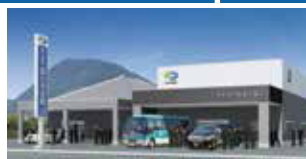
国分寺会館 高松市国分寺町柏原985-1