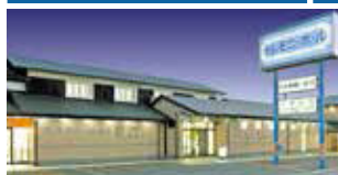
セレモニーホール綾川 綾歌郡綾川町菅原484 法道寺会館 綾歌郡綾川町山田下2056